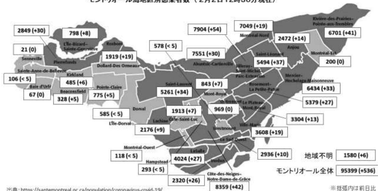
モンリオール島地区別感染者数 (2月2日12時30分現在)