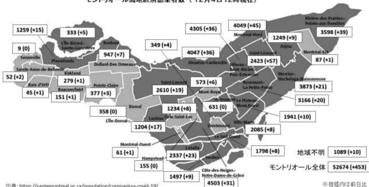
モンリオール島地区別感染者数(12月4日12時現在)