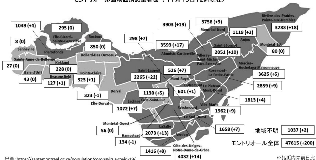
モンリオール島地区別感染者数(11月19日12時現在)