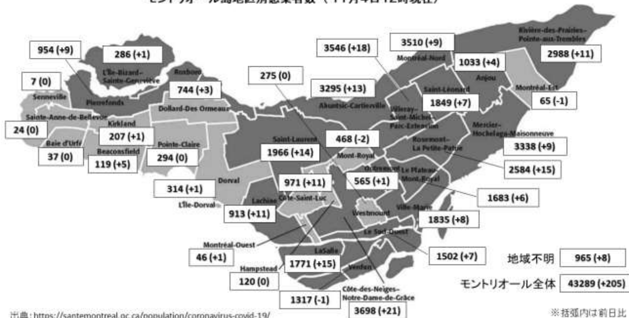
モントリオール島地区別感染者数 (11月4日12時現在)