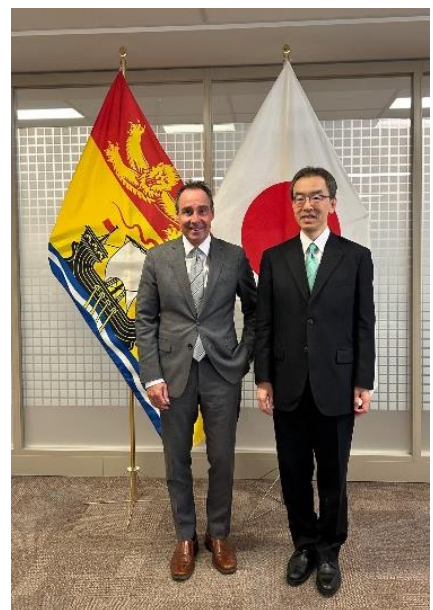
Le ministre des Ressources naturelles, John Herron