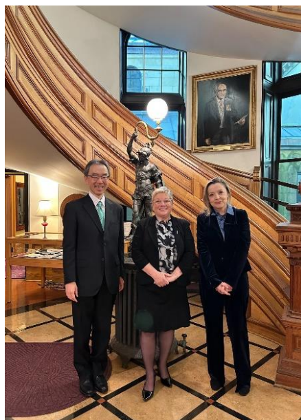
La présidente de l'Assemblée législative, Francine Landry