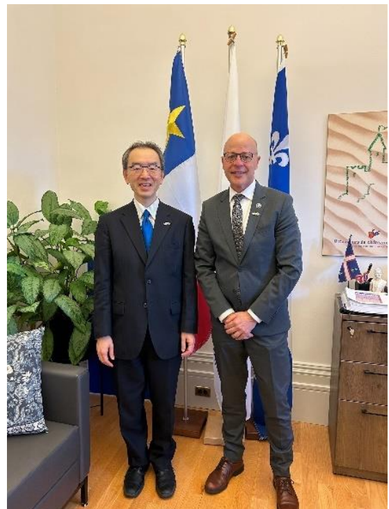
Joël Arsenault, député à l'Assemblée nationale du Québec

- Je rencontrai Joël Arsenault, député de l'Assemblée nationale du Québec et ancien participant du Programme JET, pour un échange de vues fructueux sur les relations économiques et culturelles entre le Japon et le Québec. Ce fut encourageant d'apprendre qu'il y a également au sein de l'Assemblée nationale des amis du Japon ayant vécu dans notre pays.