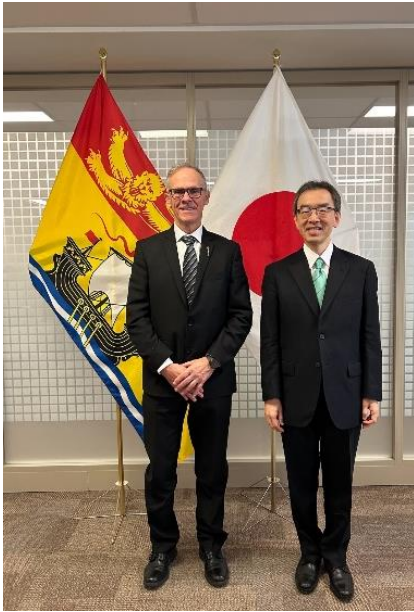
Le ministre de l'Agriculture, de l'Aquaculture et des Pêches, Pat Finnigan